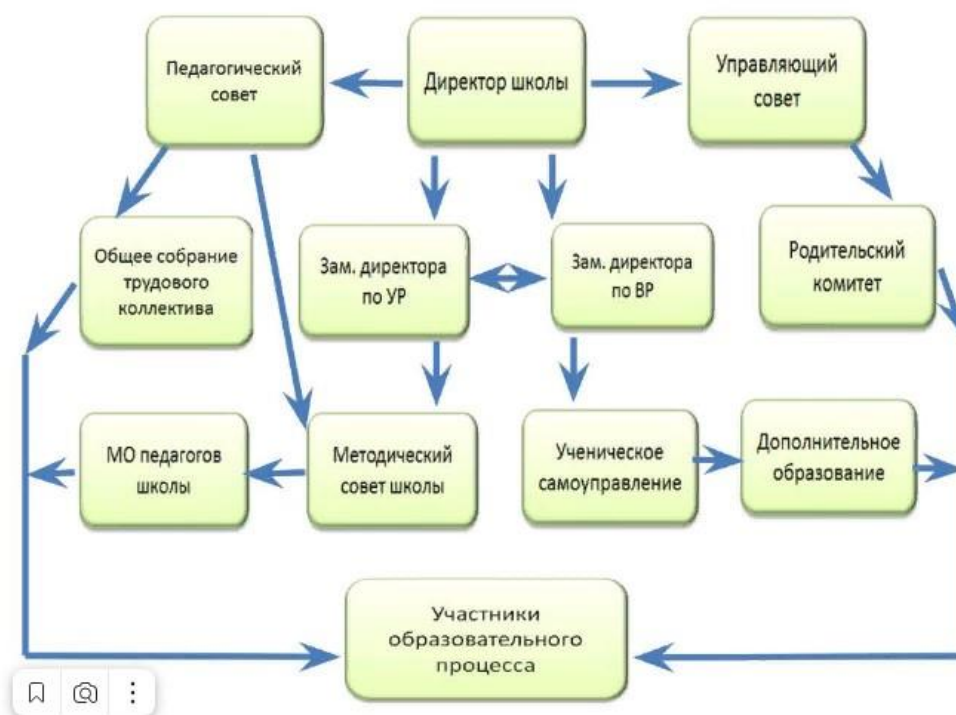
Структура и органы управления образовательной организацией

Цель управления на уровне МОУ СОШ п.Поливаново заключается в функционировании демократического учреждения, в основе которого положена идея психолого-педагогических, организационно-педагогических, социально-педагогических и правовых гарантий на полноценное образование.